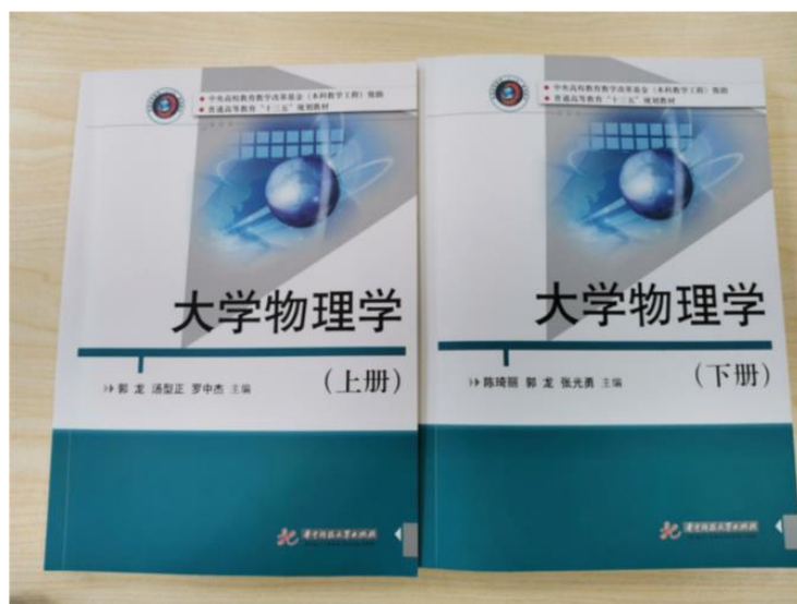
图 1: 编写教材

在教材建设上,教学团队注重大学与中学物理知识的衔接,认真研读高中物理课程质量标准 and 大学物理课程标准,为夯实和厚实学生的物理知识和架构下功夫;注重以物理知识为载体,深度挖掘伟大的物理学家的“求真、求善、求美”的精神和事迹对学生进行思政教育;注重培养同学们正确的历史观。团队编写的十三五规划教材《大学物理学》(上、下)已在今年6月正式出版(图1)。该教材在各章节中新增了相应知识模块的发展史概述,同时着力增加中国历史中绽放的物理史瑰宝。